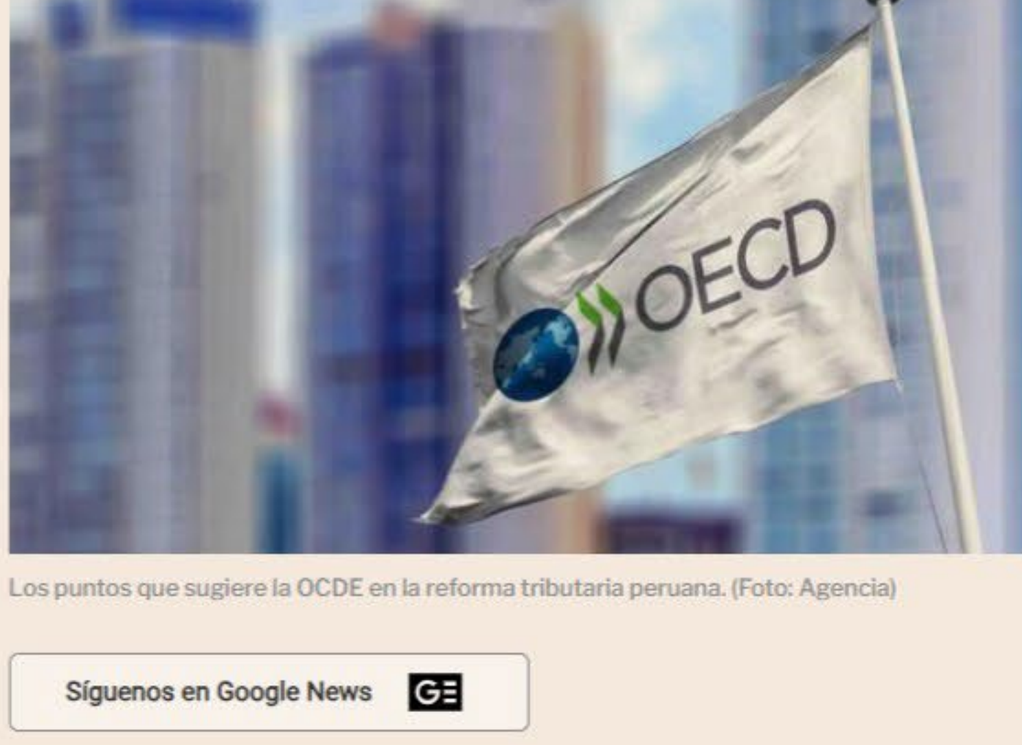
Los puntos que sugiere la OCDE en la reforma tributaria peruana.

Tras las recomendaciones de la Organización para la Cooperación y el Desarrollo Económicos (OCDE), expertos señalan qué más se puede incorporar a la reforma tributaria.